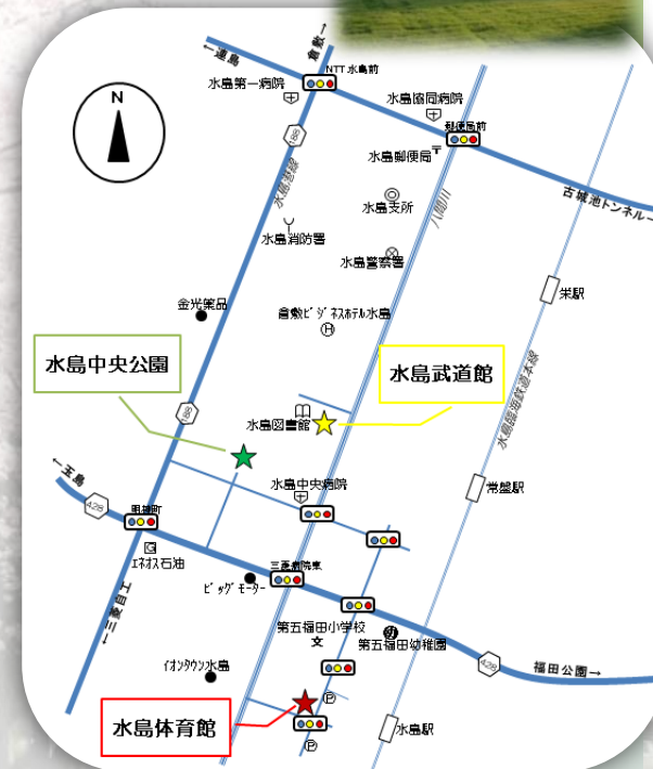
水島中央公園管理事務所