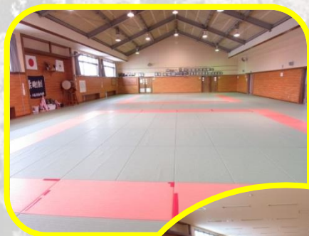
水島武道館事務所