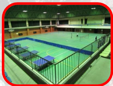
水島体育館事務所